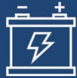
Secondary Battery Manufacturing Equipment