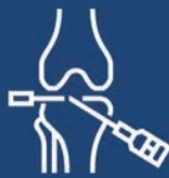
Powered Surgical Tool